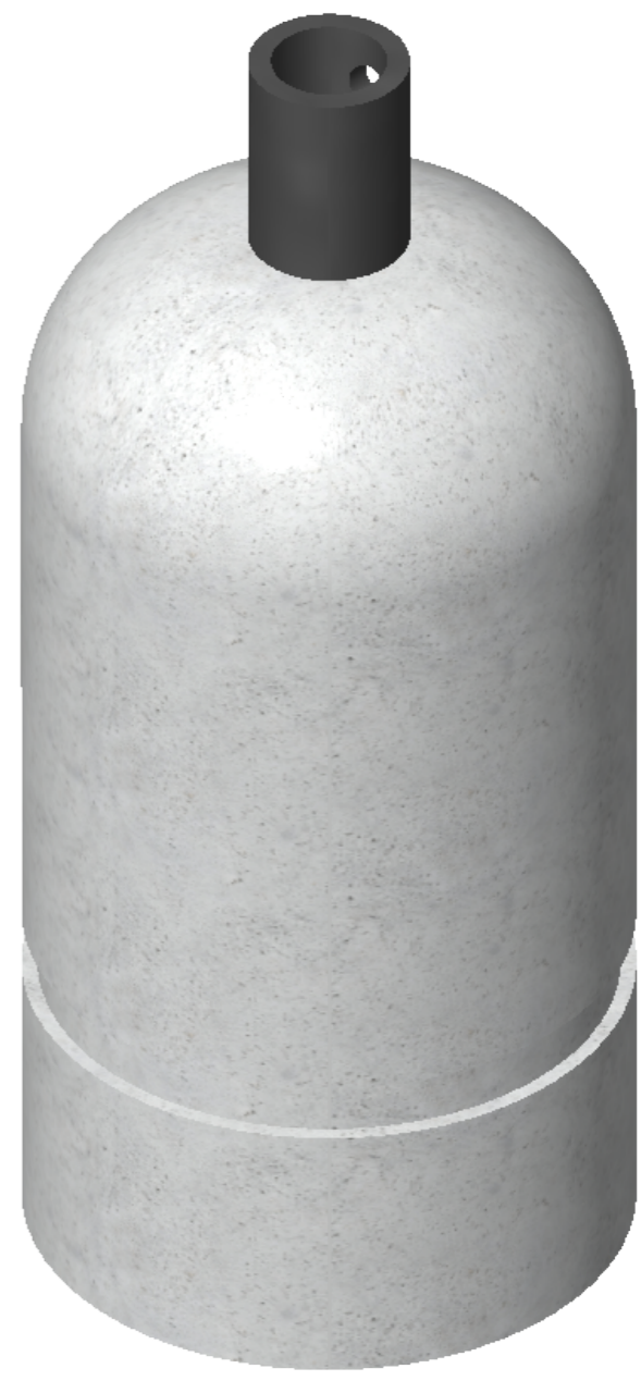
Цоколь E27 Провод в комплекте 1,5м