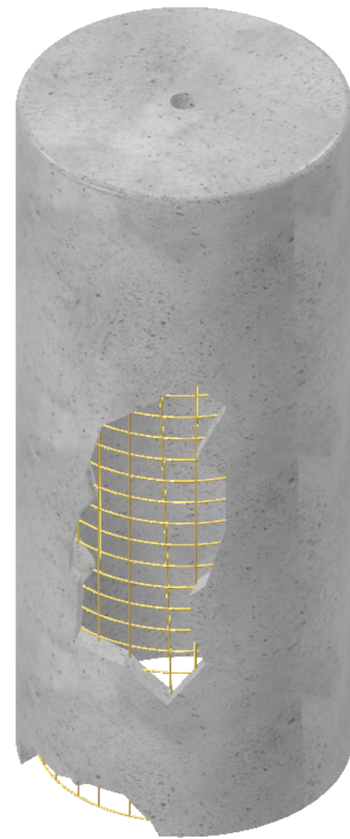
Рисунок разбитой части каждый раз разной формы Цоколь E27